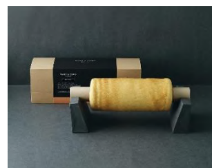
「バウムクーヘン一本焼き (オリジナル)」