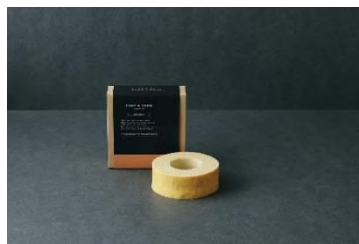
「バウムクーヘンリング (オリジナル)」