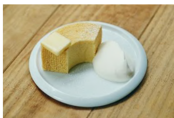
「できたてバウムクーヘン」