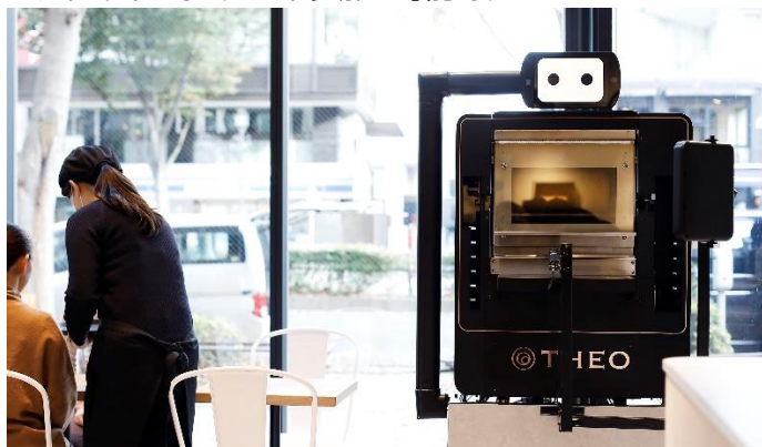
※写真は AI オープン「THEO」のイメージです。

また、本イベントは、コロナ禍での来場者による混雑を避ける為、メイン会場の他、3月3日(水)～3月7日(日)の5日間限定で表参道ミシャラクをサテライト会場として実施します。また、JR 東京駅イベントスペース「スクエア ゼロ」では、オンラインでのリモート参加も可能です。