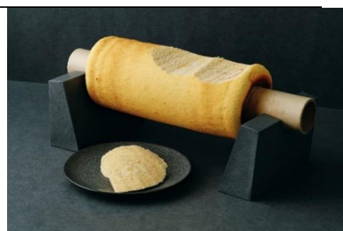
※写真はバウムクーヘンのイメージです。

https://www.makuake.com/project/juchheim_theo/ )